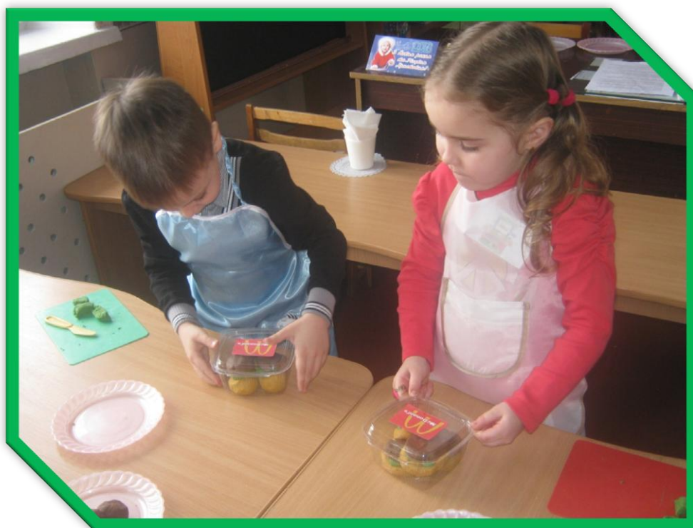
Сюжетно-рольова гра: Дитяче кафе «Макдональдс»