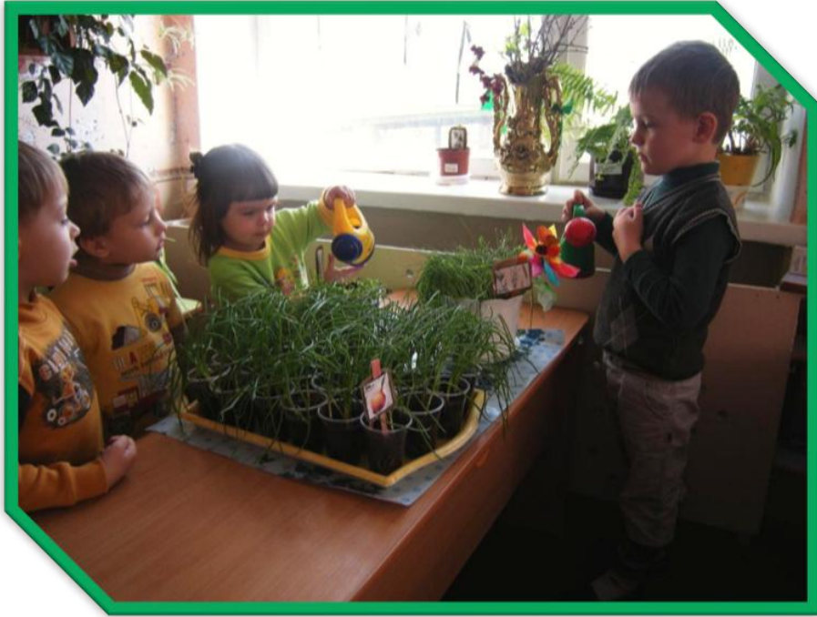
Виростає день при дні, наш городик на вікні